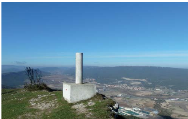
El Busto. Montes de Vitoria