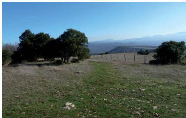
Condado de Treviño