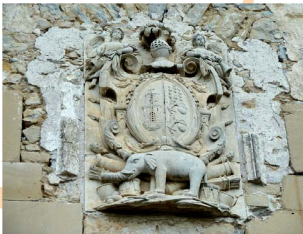
Escudo del Palacio de Simón de Anda y Salazar. Subijana de Álava.

2 [KM 4,1] SUBIJANA DE ALAVA. Entramos en Subijana por una pista amplia y recta. Destaca en su composición, el palacete barroco que mandó construir Simón de Anda y Salazar, gobernador de Manila y Filipinas a mediados del siglo XVIII. Tomando el Camino de Santiago faldeamos a la sombra de Peña Mayor para pasar después al fuerte y estrecho sendero que asciende hacia él.