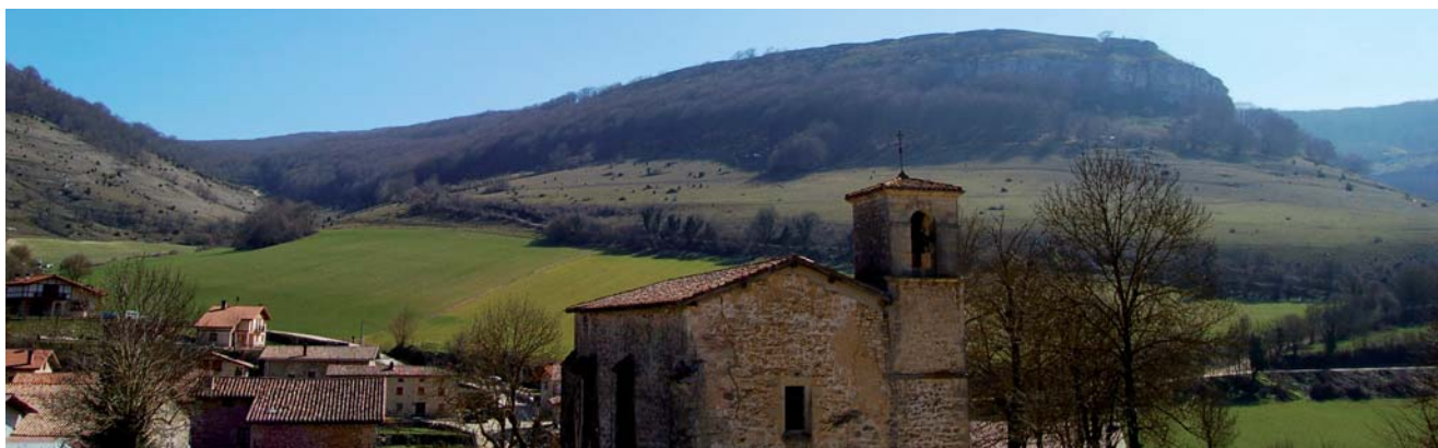
Vistas del pueblo de Okina, final de etapa.