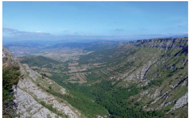
Cañón Delika. Sierra Salvada