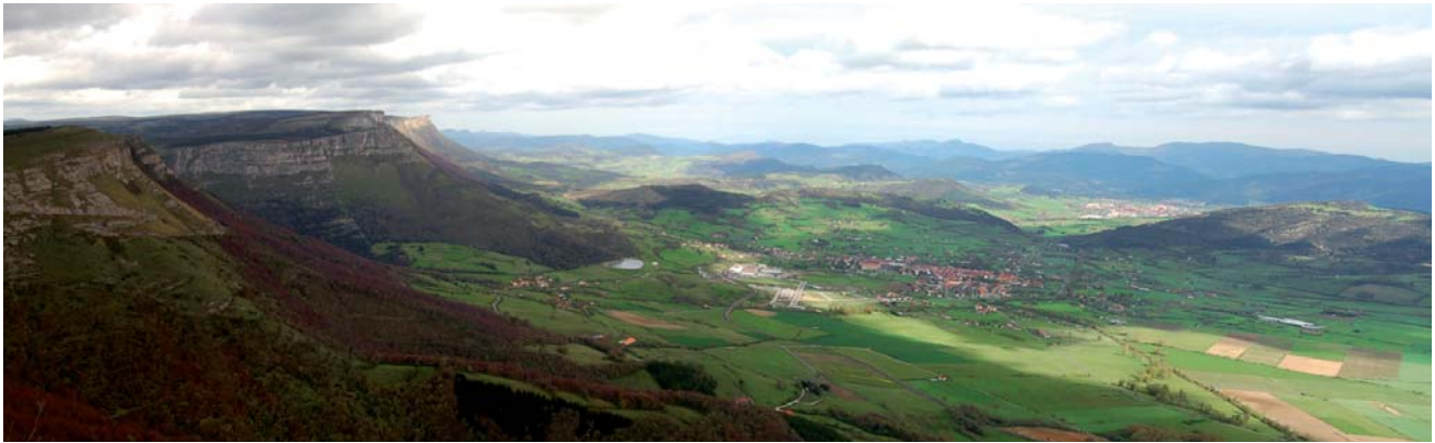
Orduña desde Sierra Salvada