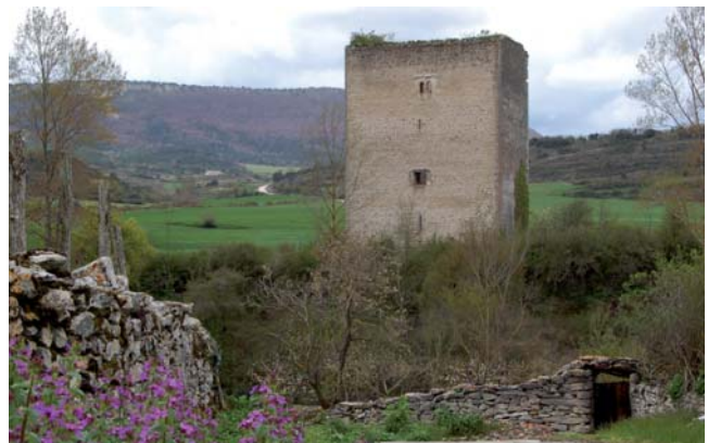
Torre de los Sánchez Velasco en Berberana