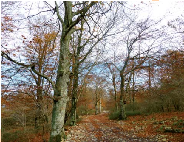
Otoño en Sierra Salvada

2 [KM 8,5] SALTO DEL NERVION. La esporádica confluencia de los arroyos Iturrigutxi, Ajiurri y Urita, nacidos entre las sierras de Gillarte y Gibijo precipita bruscamente al llegar al cortado entre Álava y Burgos, provocando un espectacular salto en el que el agua se desploma durante 220 m de altura, perdiéndose en la profundidad del cañón de Delika.