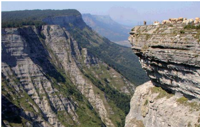
Pastos de altura