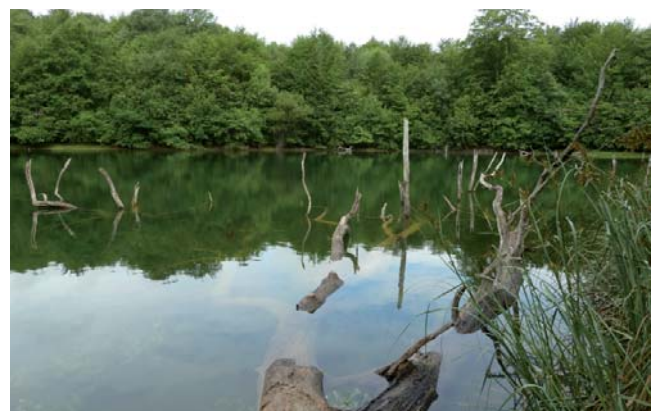
Humedal de Lamiojin