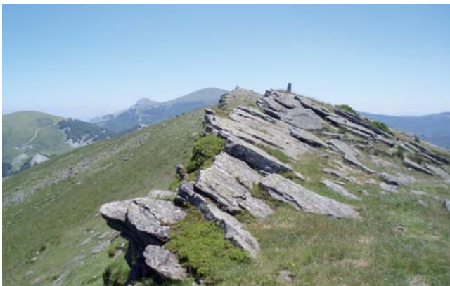
Roquedos y cimas en Gorbeia