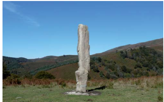
Menhir de Arlobi