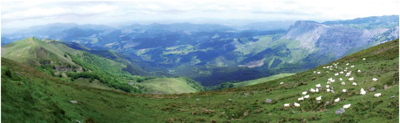
Vistas de la zona de pastos