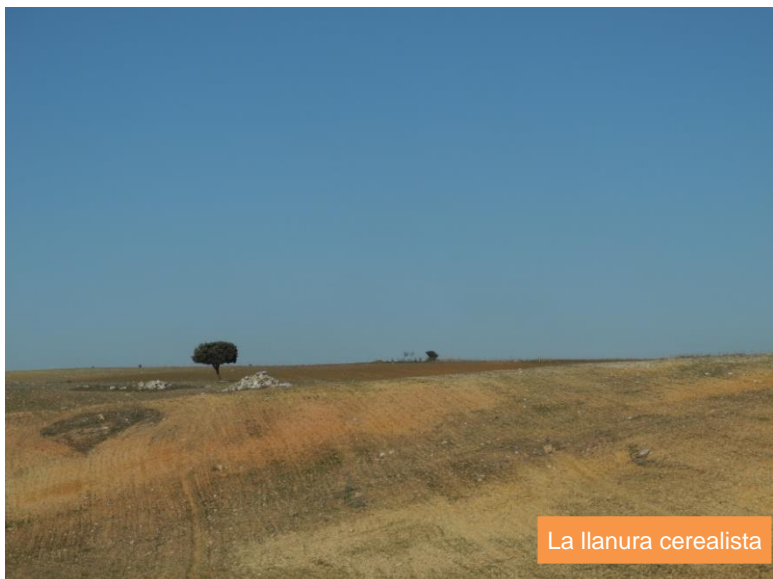
La llanura cerealista

Al alcanzar un cruce, el Camino Natural gira hacia la izquierda. El recorrido transcurre por un duro paisaje, con formaciones rocosas que afloran a la superficie por doquier, y se dulcifica al paso de la ribera de Campeán que da nombre a la puebla que junto a él se asienta: Pubblica de Campeán, una pequeña población en medio de la campiña agraria, donde no se llega a