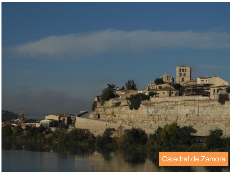
Catedral de Zamora