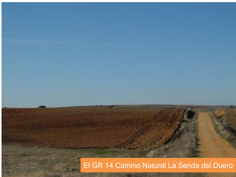
El GR 14 Camino Natural La Senda del Duero

I.G.N. Hoja 0396 – Pereruela; I.G.N. Hoja 0397 – Zamora