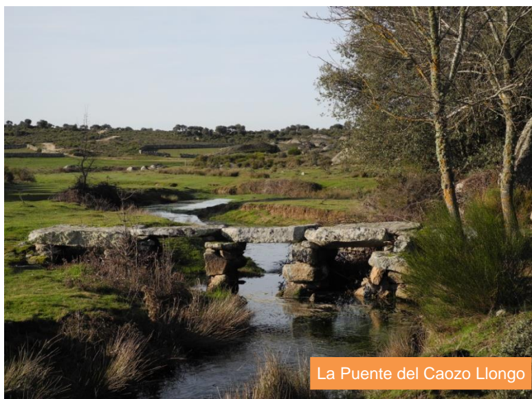
La Puente del Caozo Llongo

Dejando atrás la riera del Pontón, una pista más ancha y cuidada nos conduce, en continuo sube y baja, hasta el punto de mayor interés de la etapa: los restos del castro de Peña Redonda, antiguo castro celtibero