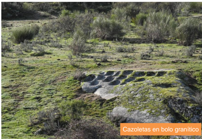
Cazoletas en bolo granítico

I.G.N. Hoja 0367 - Castro de Alcañices; I.G.N. Hoja 0368 - Carbajales de Alba; I.G.N. Hoja 0395 - Muga de Sayago; I.G.N. Hoja 0396 - Pererueta