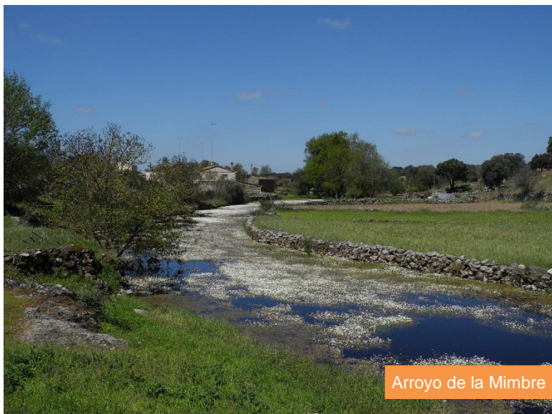
Arroyo de la Mimbre