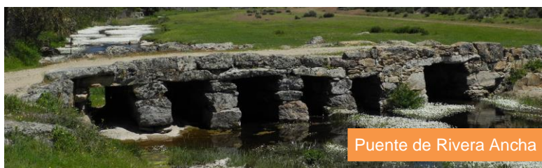
Puente de Rivera Ancha

La etapa llega a su fin entrando en Cozcurrita junto al antiguo potro de herrar, hoy en desuso, convertido en mudo testigo de las costumbres de estas tierras.