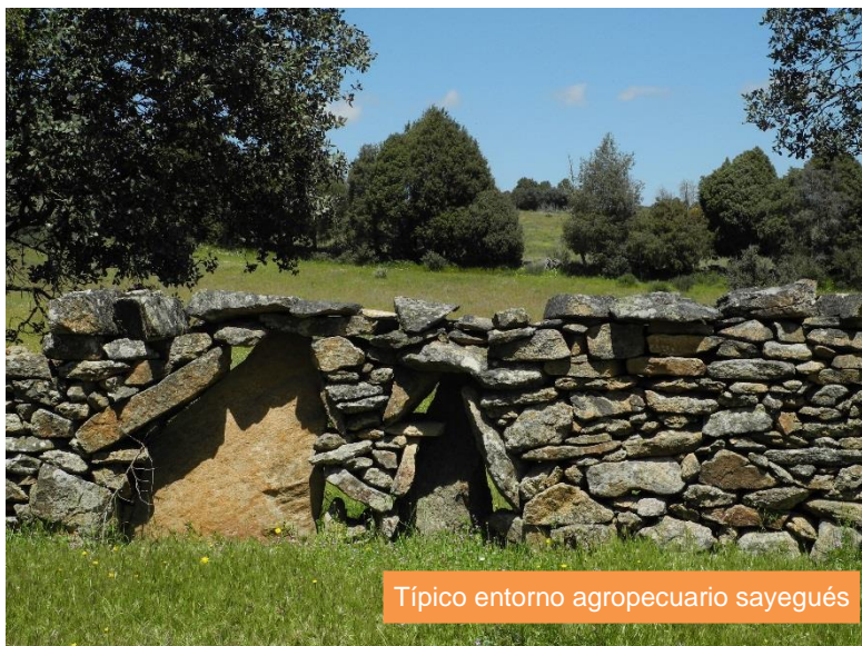
Típico entorno agropecuario sayegués

I.G.N. Hoja 0395 – Muga de Sayago; I.G.N. Hoja 0396 – Pereruela