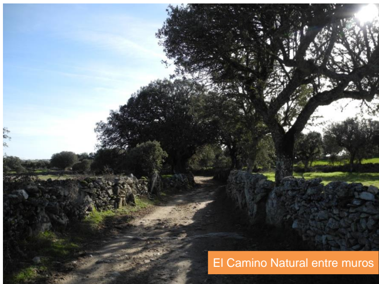
El Camino Natural entre muros

Dejando atrás el monte reaparecen las cortinas cuyas lindes configuran estrechos callejos sombreados por encinas de porte majestuoso. Después