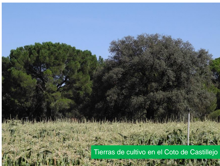
Tierras de cultivo en el Coto de Castillejo

El itinerario pasa por una gravera, al lado de una pequeña laguna, que, aunque cubierta en su mayor parte por espadañas, alberga refugio para que pequeños mamíferos como los ratones de campo ( Apodemus sylvaticus ) se acerquen a beber, mientras que los cárabos comunes ( Strix aluco ) y los búhos reales ( Bubo bubo ) acechan para capturarlos.