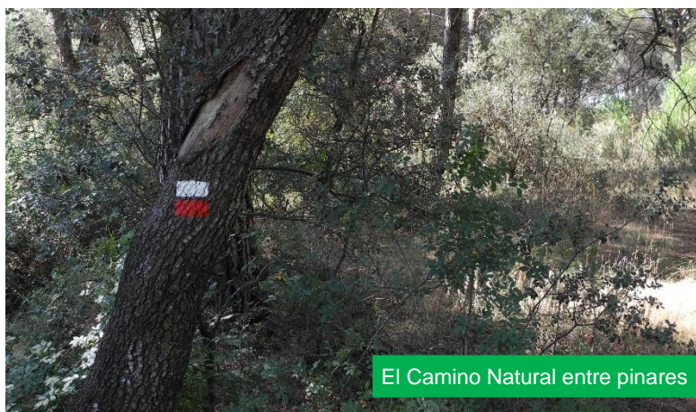
El Camino Natural entre pinares