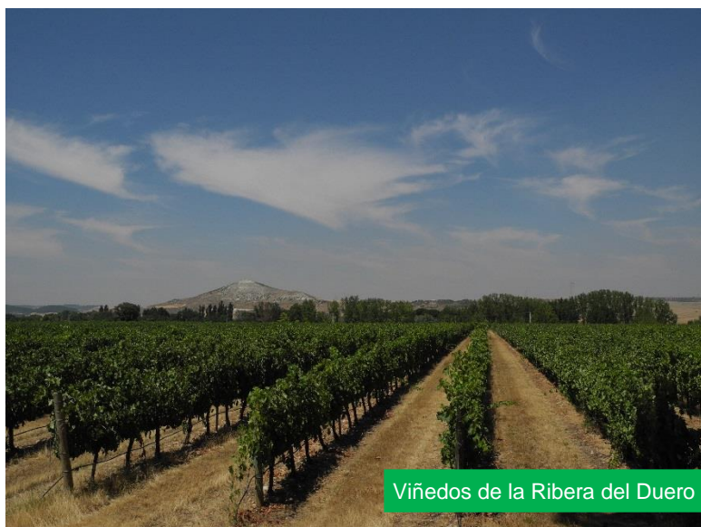
Viñedos de la Ribera del Duero

I.G.N. Hoja 0372 – Valladolid; I.G.N. Hoja 0373 – Quintanilla de Onésimo