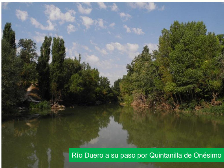
Río Duero a su paso por Quintanilla de Onésimo