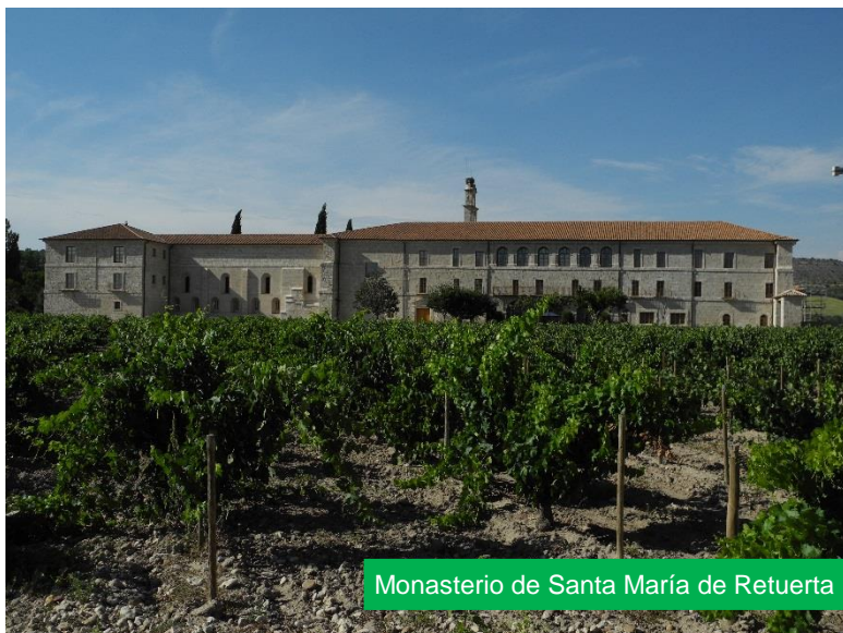
Monasterio de Santa María de Retuerta

El Camino Natural pasa por debajo de la autovía A-11 y alcanza un espectacular meandro del río, en las inmediaciones de Tudela de Duero, de singular belleza. La entrada en esta localidad se hace por un puente peatonal que cruza el río Duero, hasta llegar al centro urbano, desde donde se desciende hasta el parque urbano del río, donde concluye la etapa.