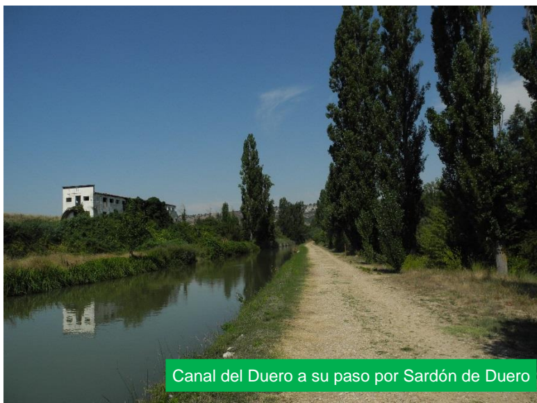
Canal del Duero a su paso por Sardón de Duero

Hoy se puede disfrutar de un magnífico recorrido entre el río y el canal, que transcurren paralelos desde Quintanilla hasta más allá de Sardón de Duero, y admirar la riqueza paisajística y ecológica, que es debida a la abundante vegetación que bordea su curso, llegando a sorprender en algunos puntos sus increíbles vistas.