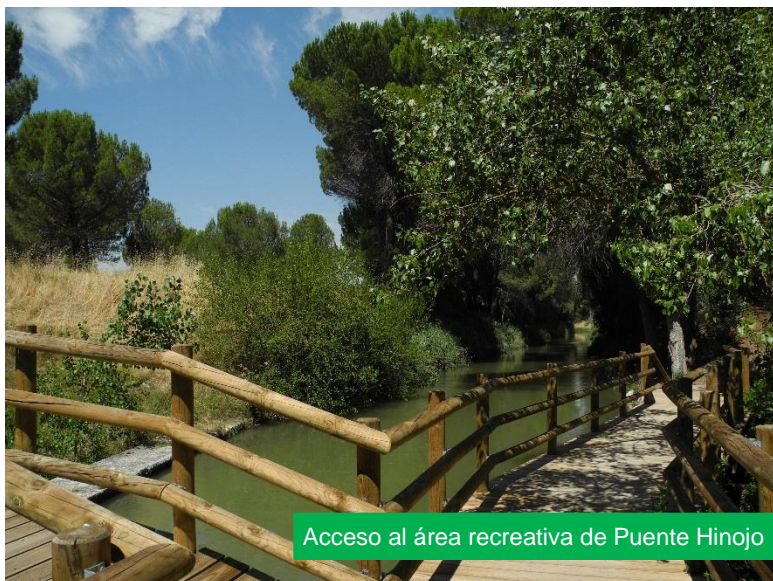
Acceso al área recreativa de Puente Hinojo

Más adelante el Canal del Duero cruza el río Duero por un viaducto y la Senda del Duero continúa por un camino que discurre próximo a la margen izquierda del río, entre un frondoso bosque de ribera. A medida que nos aproximamos a Tudela de Duero el paisaje se humaniza y el bosque se reduce a alineaciones de chopos, que en el otoño se tiñen de colores verdes, amarillos, ocre y marrones de gran armonía cromática.